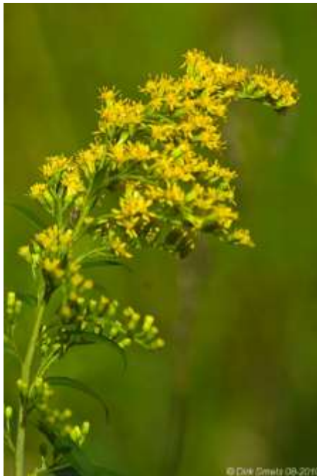
Late guldenroede ( Solidago gigantea )