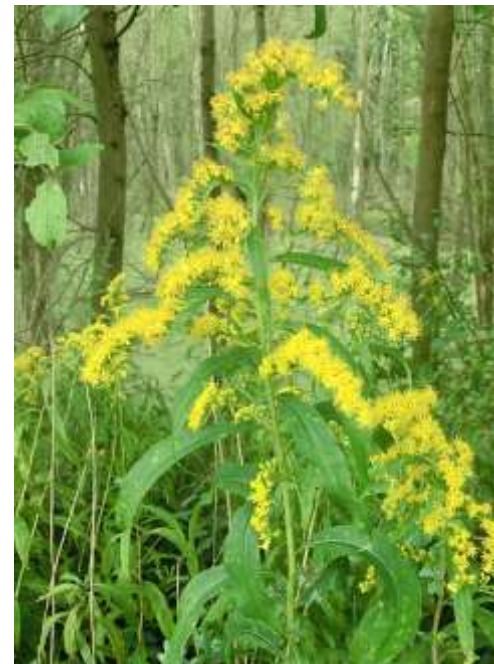
Canadese guldenroede ( Solidago canadensis )