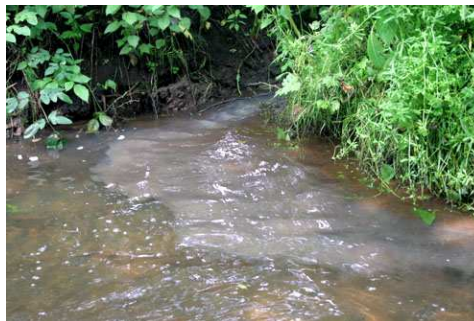
vreemde instroom; van nabijgelegen vijver?