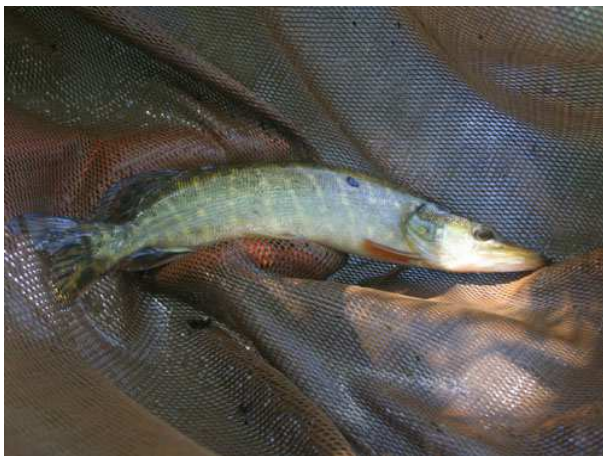
Snoek ( 3 ex.)