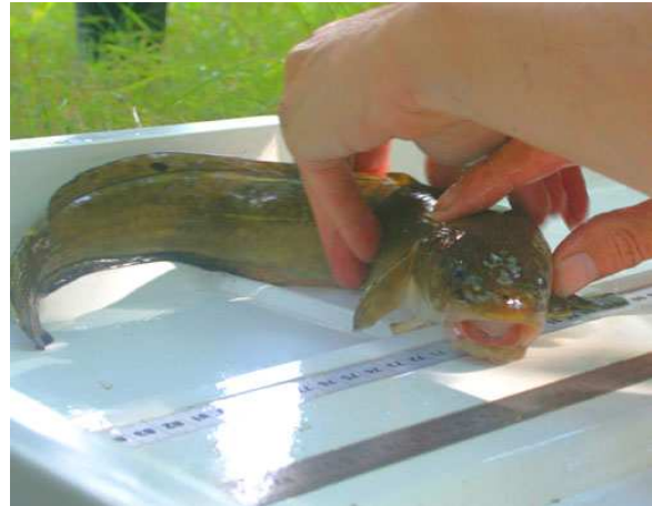
Kwabaal ( 8 ex.)