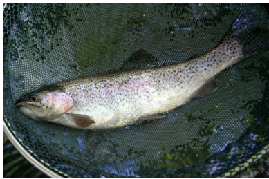
3 regenboogforellen van 34, 36 en 38 cm