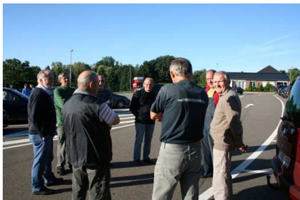
Samenkomst aan de Kerk van Opoeteren om 9.00 u

Het visonderzoek kadert binnen geplande en reeds uitgevoerde natuurtechnische ingrepen aan provinciale waterlopen die bestendig zijn als natte natuurverbinding (Bosbeek). De gegevens zullen bijdragen tot het vastleggen van de nulsituatie. Verder worden enkele zijbeken (Busselziep, Kattenbeek, Kleine Beek, Lietenbeek, Kreeftenbeek) onderzocht op vraag van het hoofdbestuur van ANB specifiek naar het voorkomen van een relictpopulatie beekprik.