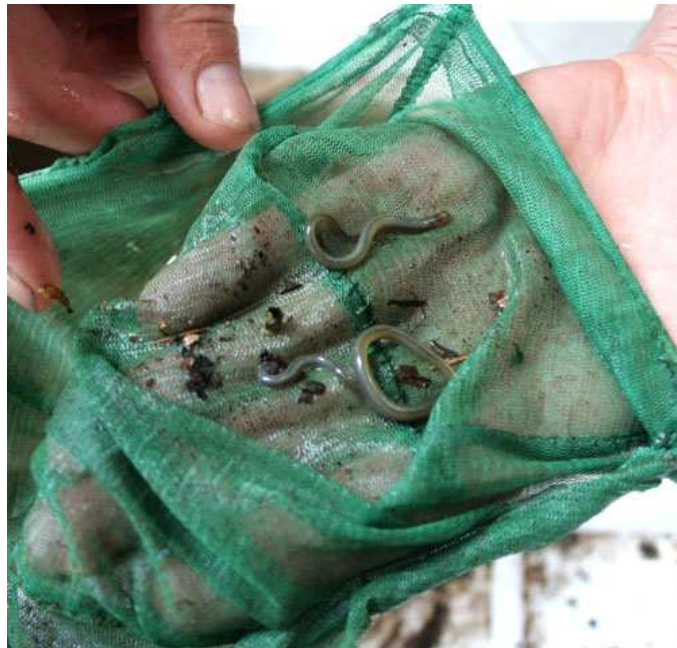
30 meter bevist, 30 larven van beekprik, waarvan de kleinste 2 cm !