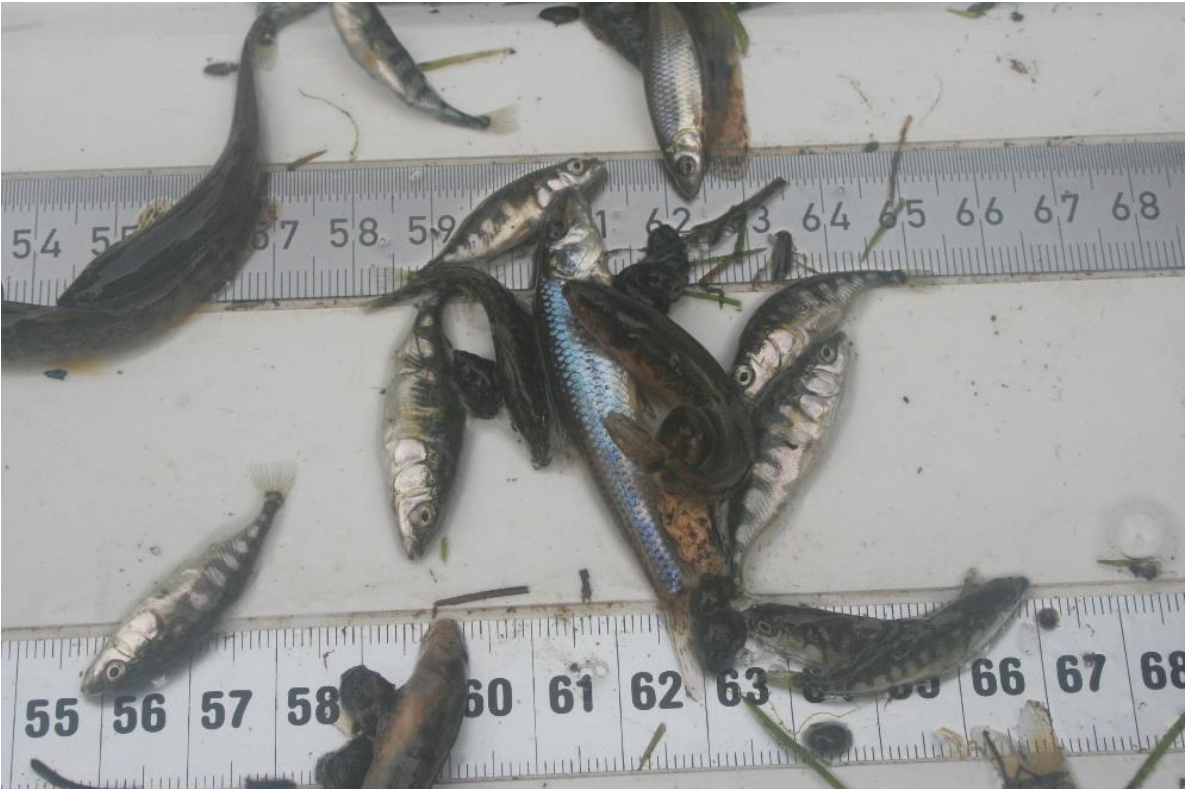
Meetpunt 3 en 4: